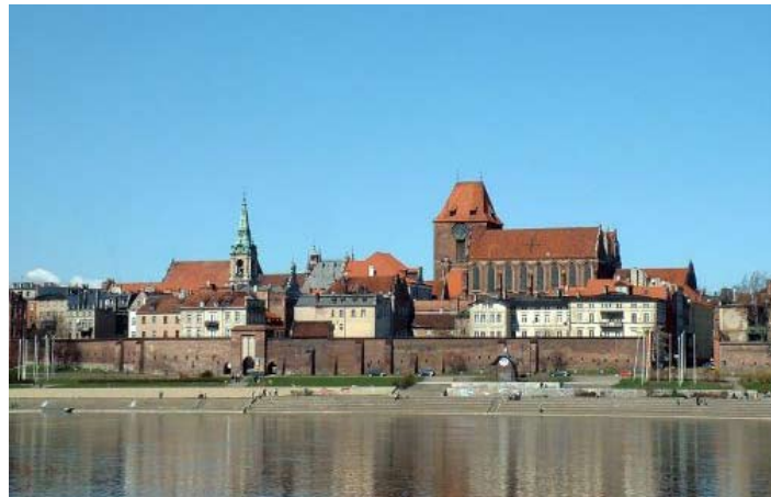
Zicht op de oude stad van Torún.

Het Poolse Torún ligt aan de rivier de Vistula. De stad is beroemd om zijn schitterende historische centrum, dat is opgenomen in de Werelderfgoedlijst.