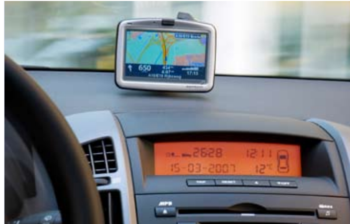
Navigatiesystemen weten zeer veel over de weg, maar niet alles.

Een navigatiesysteem is beslist zeer handig. Wie de aanwijzingen blind opvolgt, riskeert echter met een nat pak of cement aan zijn schoenen thuis te komen.