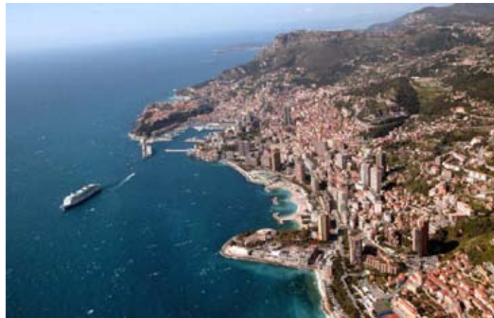
Monaco, populair bij de jetset en bij toeristen.

Monaco is vooral bekend om de casino's, de jetset en natuurlijk de familie Grimaldi, die al meer dan 700 jaar de scepter over dit idyllische ministaatje zwaait.