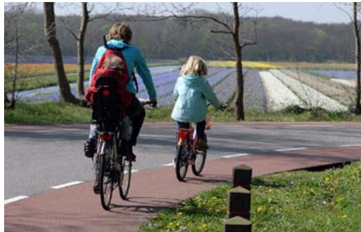
De bollenstreek is bij fietsers momenteel bijzonder in trek.