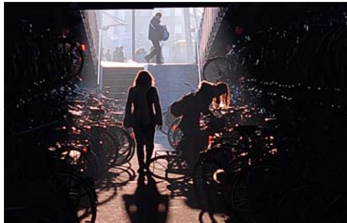
Door de groeiende behoefte aan plekken raken de stallingen overvol.

In Nederland wordt de fiets belangrijker als vervoermiddel voor en na de treinreis. Daarmee groeit de vraag naar fietsenstallingen bij stations.